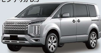
三菱 デリカ D:5