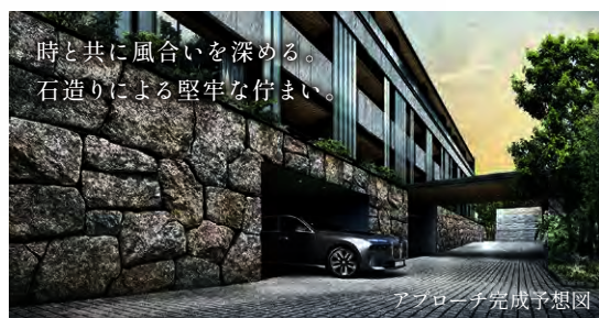
アプローチ完成予想図