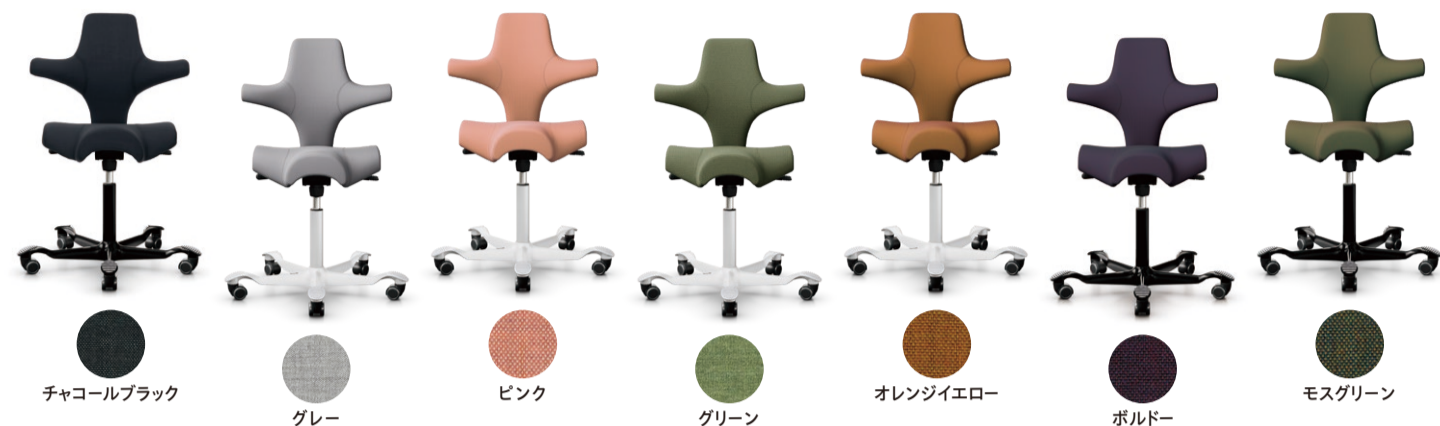
チャコールブラック

品番: HÅG Capisco 8106 / 外形寸法(mm): W730×D730×H810-1040 / 座面高(mm): SH417-547 / 重量: 14kg 希望小売価格: ¥235,400(税込)