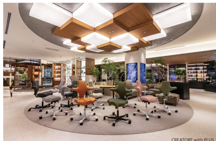
CREATORE with PLUS